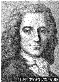
IL FILOSOFO VOLTAIRE

Le meditazioni dell'uomo sul suo destino e sull'ignoto che si nasconde nel tempo innanzi a lui sono logicamente tra le più gravi e conturbanti per loro implicazioni esistenziali, morali e anche sociali; nessuna persona pensante vi sfugge, tanto meno i filosofi con diverse passioni e avvolti in contraddizioni da cui essi stessi non sanno districarsi. Solo un imbecille può dire: «Il medico ha salvato mia zia e le ha allungato la vita di dieci anni: macché, non ha fatto che eseguire ciò che doveva comunque accadere, mia zia doveva ammalarsi e il medico non poteva non prescrivere le medicine che l'avrebbero guarita» - argomenta Voltaire. Le varie teorie che si affrontano sono già presentate nel De fato di Cicerone, un'ardua opera perché arduo appunto è il problema e perché ci è giunta essa stessa gravemente mutila. I due estremi opposti sono incarnati negli stoici e negli